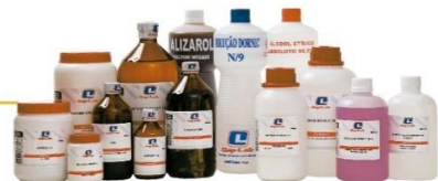
SOLUÇÕES E REAGENTES