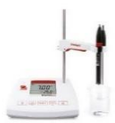
pHmetro Bancada Starter 2100