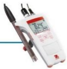
pHmetro Portátil Starter 300