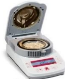
Analisador de Umidade MB 25