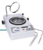
Contador de Colônia Digital