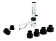
Dispensador de Volume Variável