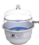
Dessecador em Polipropileno