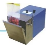
Homogeneizador de Amostra Stomacher