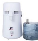
Destilador de Água Bancada